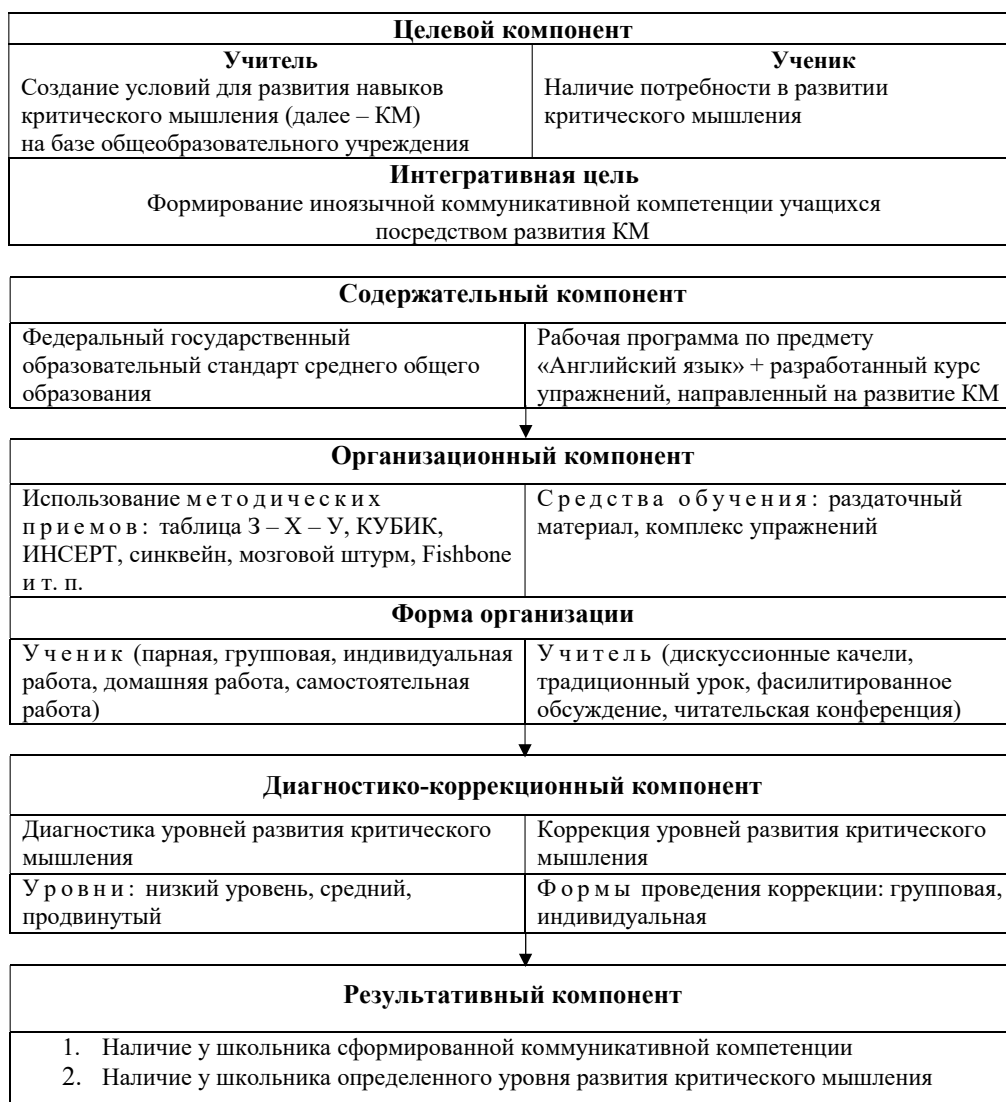
Рис. 1. Модель развития критического мышления в процессе обучения английскому языку

Эмпирический этап данного исследования открыл констатирующий эксперимент, целью которого стало выявление уровня сформированности критического мышления обучающихся. Для достижения данной цели были применены следующие методики: методика определения интеллектуальных умений (тест-опросник Ю.Ф. Гущина), тест Липпмана «Логические закономерности», методика диагностики рефлексивности А.В. Карпова.