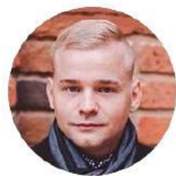
Був Антон #Визуализация